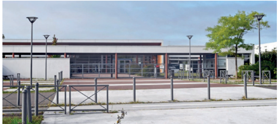
Collège «Les Sables d'Or» de Thouaré-sur-Loire

Dans l'ensemble, les professionnels interrogés étaient plutôt satisfaits des échanges et de l'implication des élèves au cours des